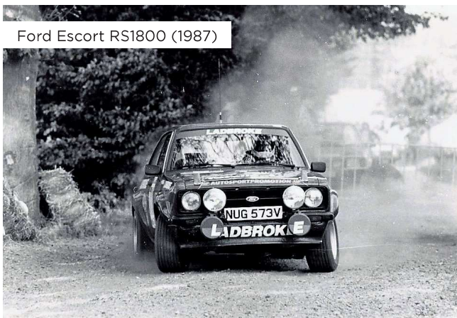
Ford Escort RS1800 (1987)