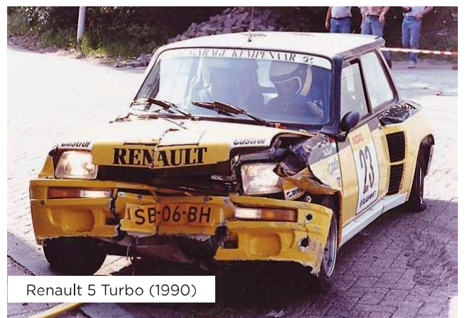
Renault 5 Turbo (1990)

Tout a commencé à l'âge de 14 ans, un de ses meilleurs amis est le fils d'un manager d'une équipe automobile. Il va donc régulièrement