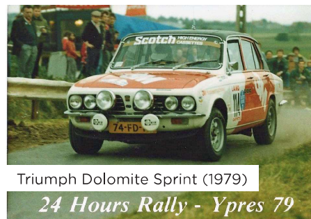
Triumph Dolomite Sprint (1979)