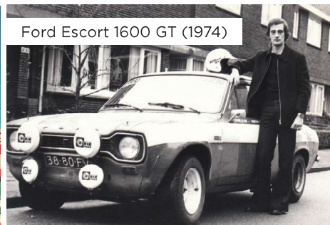
Ford Escort 1600 GT (1974)