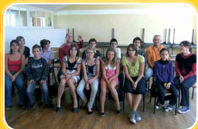
Foyer des Jeunes