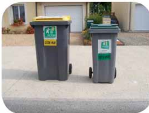
Positionnement idéal des deux conteneurs.