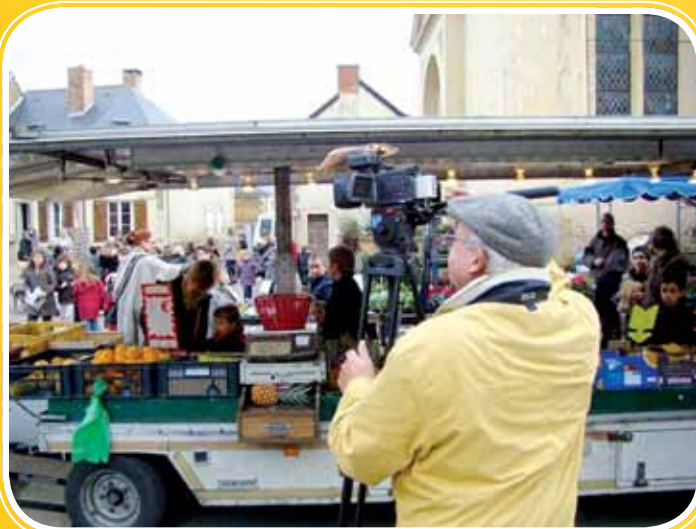
Le Tournage d'un film