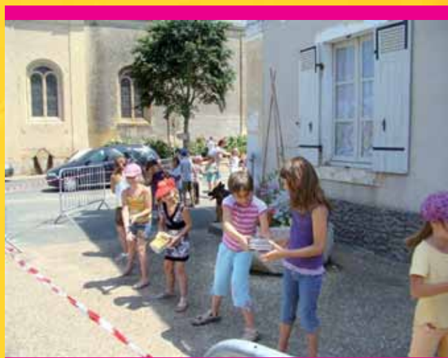
Déplacement des livres à la chaîne