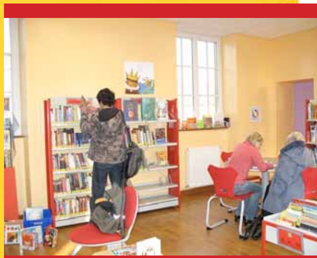
Tables de consultation...