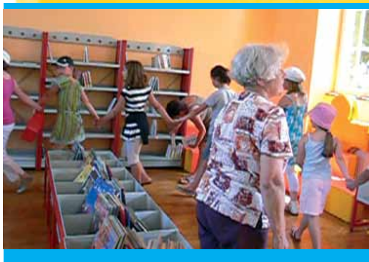
... à la bibliothèque