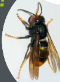
FRELON ASIATIQUE NUISIBLE