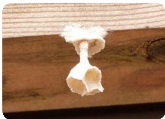
UN PRÉ-NID DÉTRUIT C'EST UN NID DE FIN DE SAISON ÉVITÉ