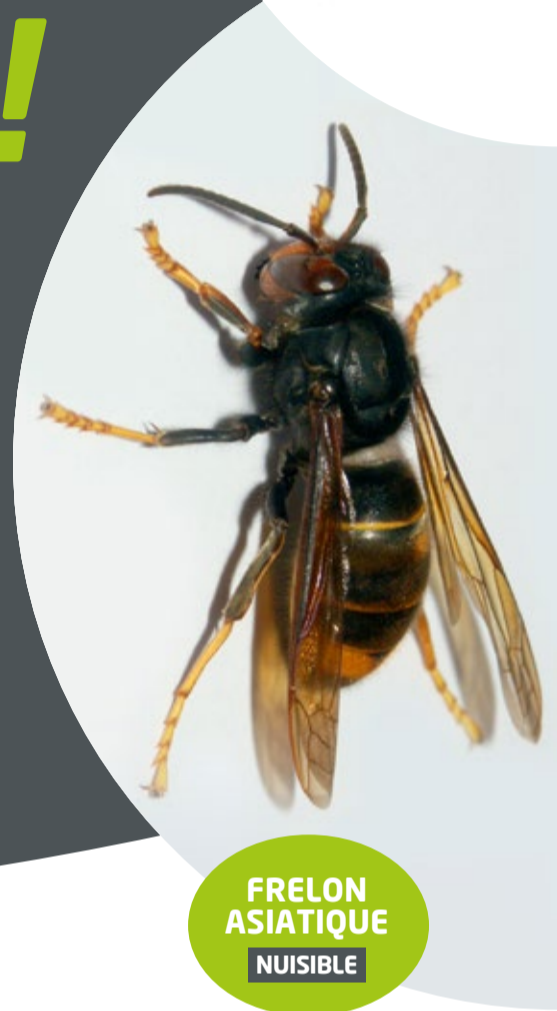
FRELON ASIATIQUE NUISIBLE