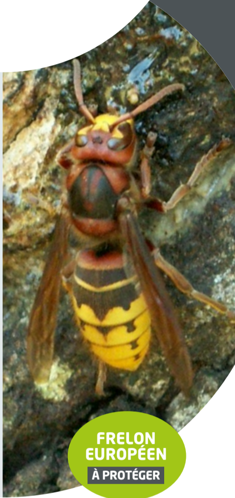
FRELON EUROPÉEN À PROTÉGER