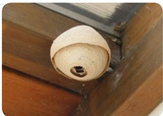
NID DE FRELON ASIATIQUE SOUS DES RIVES DE TOITURES