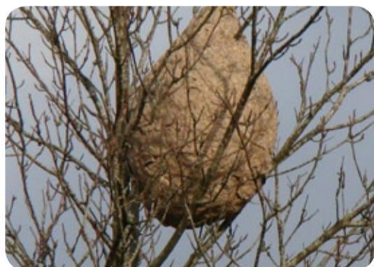
NID DE FRELON ASIATIQUE EN FIN DE SAISON DANS UN ARBRE